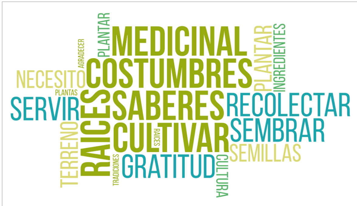
Figura 3. Palabras clave identificadas en las preguntas relacionadas con el vínculo con la naturaleza.

Esta relación simbiótica con la naturaleza es un elemento central en muchas cosmologías indígenas y refleja una ecología cultural donde la salud humana y la del ecosistema son interdependientes, criticando prácticas de salud que ignoran el impacto ecológico (figura 3).