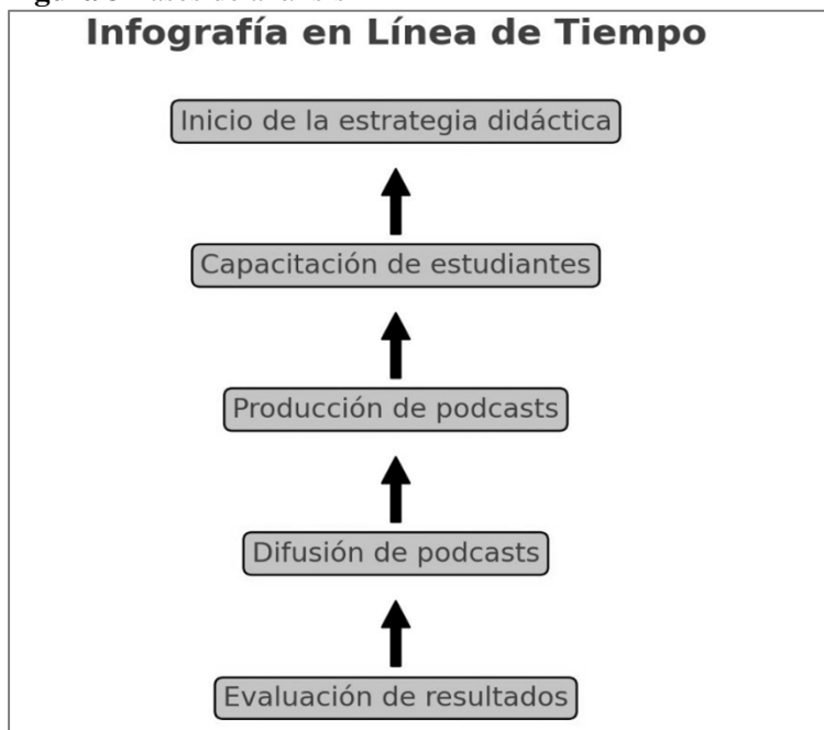
Figura 3 Fases de análisis

apoyo técnico y emocional necesario para garantizar una implementación exitosa y sostenible. La integración de la memoria histórica y el diálogo en la educación no solo honra a las víctimas del conflicto, sino que también contribuye a la construcción de una sociedad más justa y pacífica, como lo destacan múltiples estudios y autores en el campo de la educación para la paz .