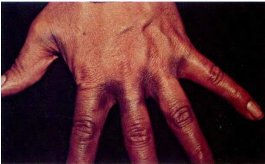
Figura 1. Liquen plano pigmentado que compromete espacios interdigitales

Tomado de: Duque, M. Leon, W. Liquen plano pigmentoso. Revista Asociación Colombiana de Dermatología & Cirugía Dermatológica. 2002; 10 (1).