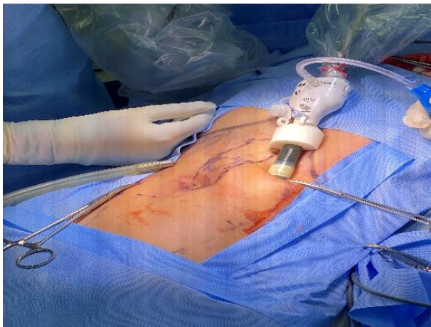
Ilustración 2 Acceso al espacio retromuscular