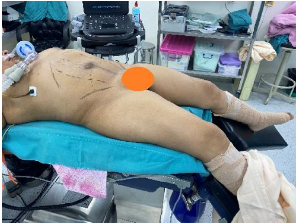
Ilustración 1 Posición del paciente en la sala de operaciones.