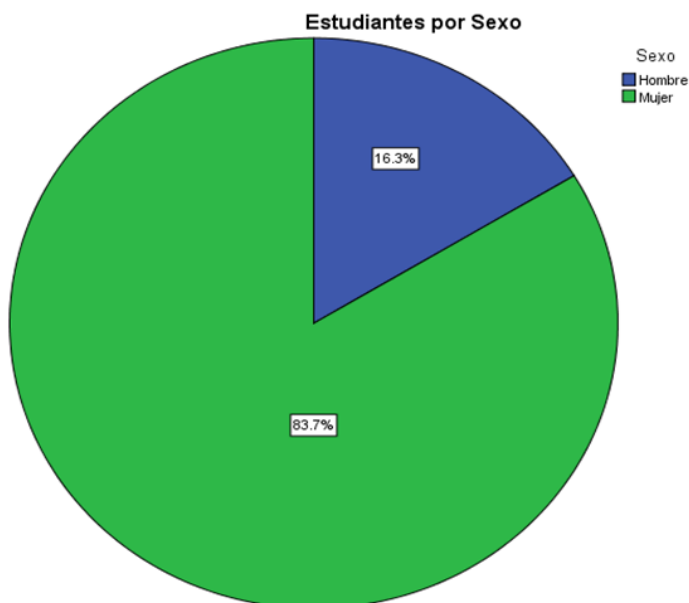
Figura 1. Composición de la muestra según sexo.

Resultados sobre ciberviolencia en el noviazgo