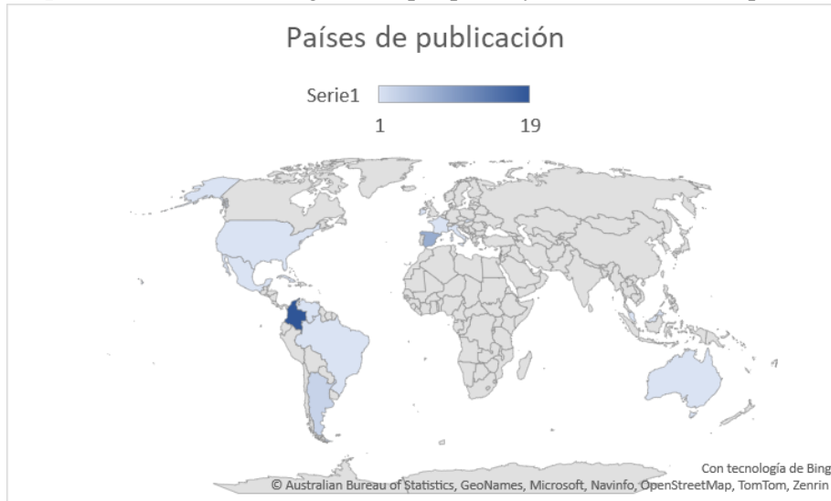
Mapa 1 Cantidad de investigaciones por países y colaboración entre países