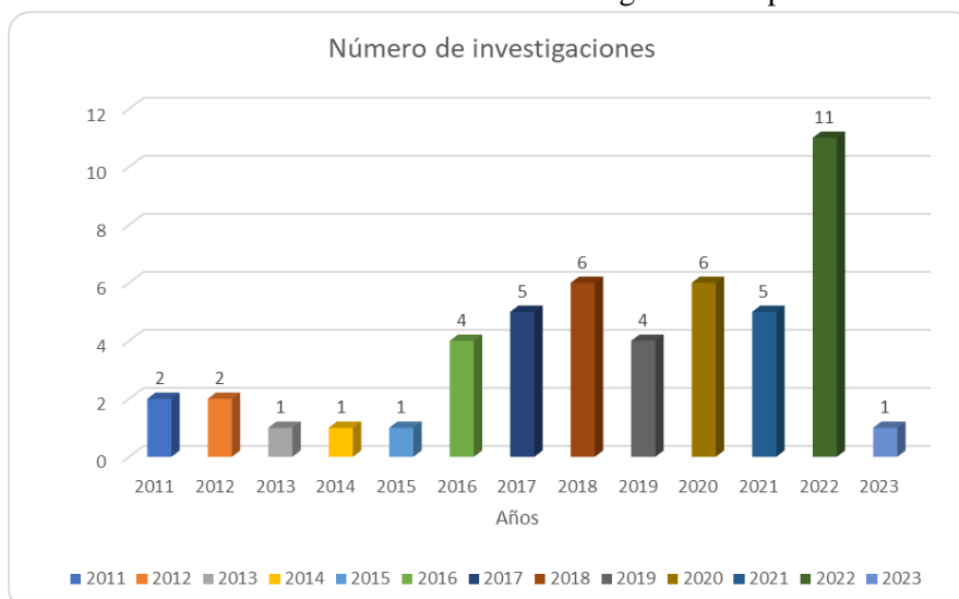
Gráfico 3 Cantidad de estudios identificados según año de producción

Fueron escritos en español, inglés y portugués entre el año 2011 y el 2023, existiendo una recurrencia de producción sobre los 4 conceptos en los últimos siete años (2016-2022).