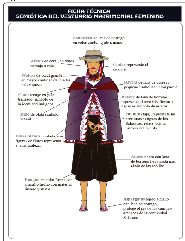
Figura 4. Semiótica del vestuario matrimonial femenino

Este vestuario simboliza aspectos relacionados con la riqueza, identidad indígena, la historia del pueblo y la conexión con la naturaleza, reflejando elementos fundamentales de la cultura de los Salasacas.