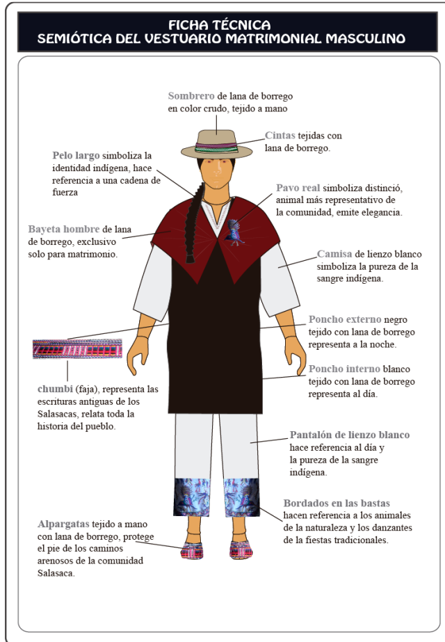
Figura 2. Semiótica del vestuario matrimonial masculino

Cada pieza tiene un profundo significado cultural y simbólico, reflejando la identidad, la riqueza, la historia y las tradiciones de la comunidad indígena Salasaca.