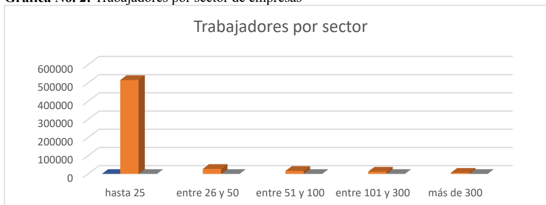
Grafica No. 2: Trabajadores por sector de empresas