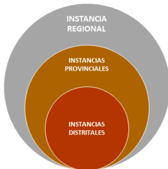
Figura 3. Instancias de concertación – Niveles de Gobierno

Nota. Tomado de “Rol de los gobiernos locales y regionales para la prevención y erradicación de la violencia contra las mujeres e integrantes del grupo familiar”, por el Observatorio Nacional de la violencia contra las Mujeres y los Integrantes del Grupo Familiar CEIC, 2021.