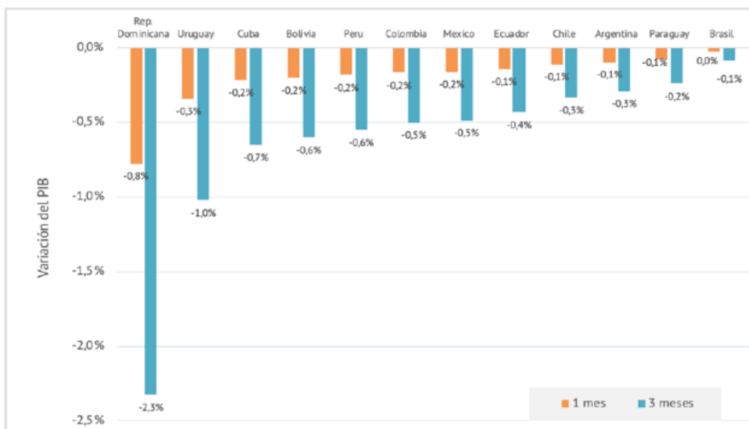
Figura 4 Impacto en el derivado de la caída del sector Turismo 2020.

Nota: la figura muestra el impacto en el derivado de la caída del sector Turismo 2020.