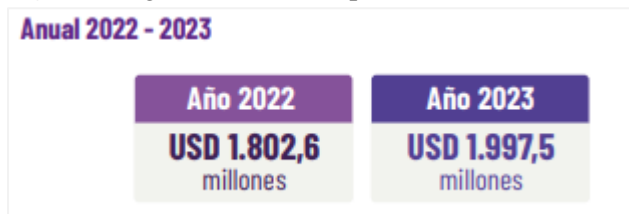
Figura 1 Ingresos de divisas por turismo

Nota: la gráfica representa el ingreso de divisas por turismo del año 2022 – 2023. Tomado de Panorama estadístico Turísticas, por Ministerio de Turismo, 2024. Captur.