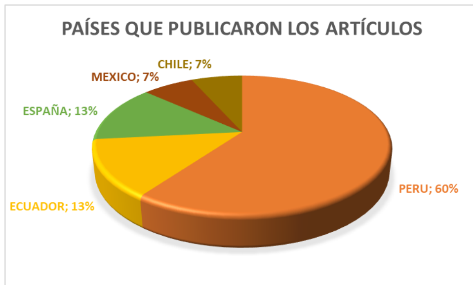
Figura 3. Países que publicaron los artículos

Igualmente, de la revisión de los 15 artículos de los textos completos seleccionados, se presentan a continuación de manera descriptiva, ya que la naturaleza de estos estudios no permite ningún otro tipo de análisis de igual manera, la tabla 1 presenta los resultados de manera concisa.