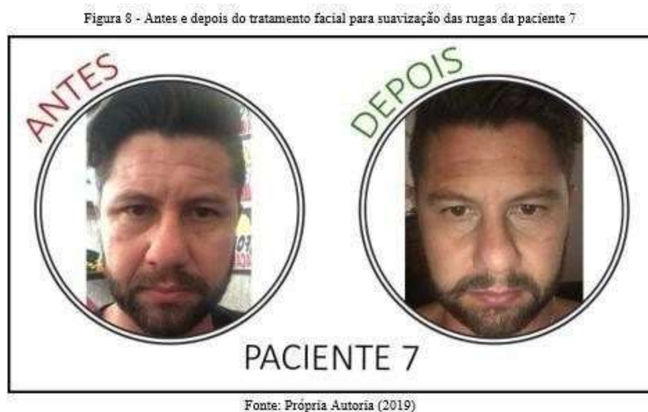
Foto do depois foi tirada após 30 dias do tratamento, vide Figura 8. Mescla Intradérmica/ Técnica Nappage/ Mescla: Vitamina A/A.H/Silício Orgânico/DMAE/Fator de Crescimento. Não foi efetivado Peeling Orgânico.

Tratamiento facial para suavización das rugas da paciente 7, realizado em sessão única, conforme Figura 8.