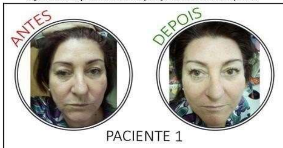
Figura 2 - Antes e depois do tratamento facial para rejuvenescimento do tecido da paciente 1