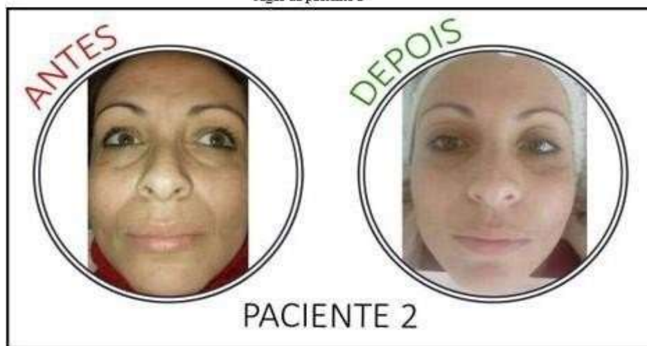
Figura 3 - Antes e depois do tratamento facial, para clareamento das discromias e suavização das rugas da paciente 2

Tratamento facial para clareamento das discromias e suavização das rugas da paciente 2, realizado em sessão única, conforme Figura 3.