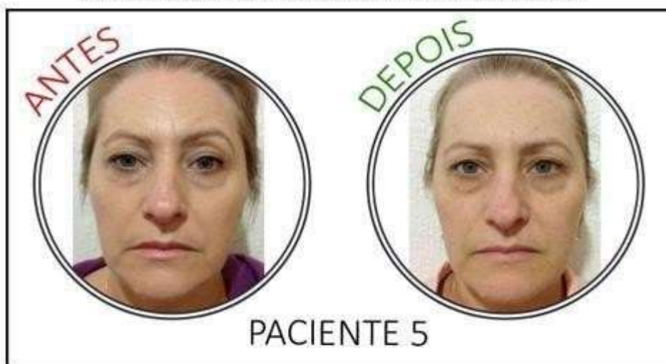
Figura 6 - Antes e depois do tratamento facial para suavização das rugas da paciente 5

Tratamento facial para ptose e suavização das rugas da paciente 6, realizado em sessão única, conforme Figura 7.