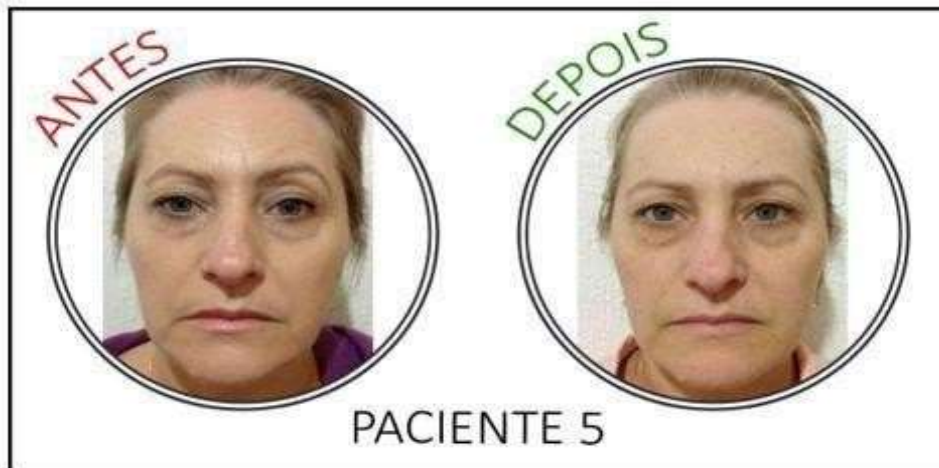
Figura 6 - Antes e depois do tratamento facial para suavização das rugas da paciente 5

Tratamento facial para suavização das rugas da paciente 5, realizado em sessão única, conforme Figura 6.