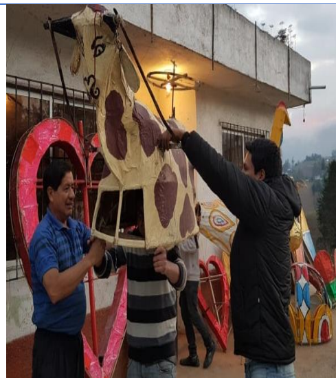
La Vaca Loca, pieza pirotécnica tradicional elaborada por productores locales