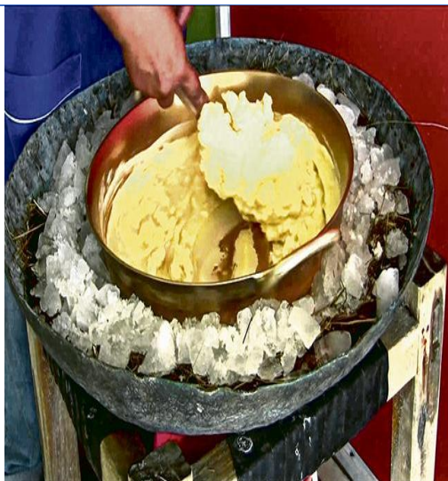
Helados en paila