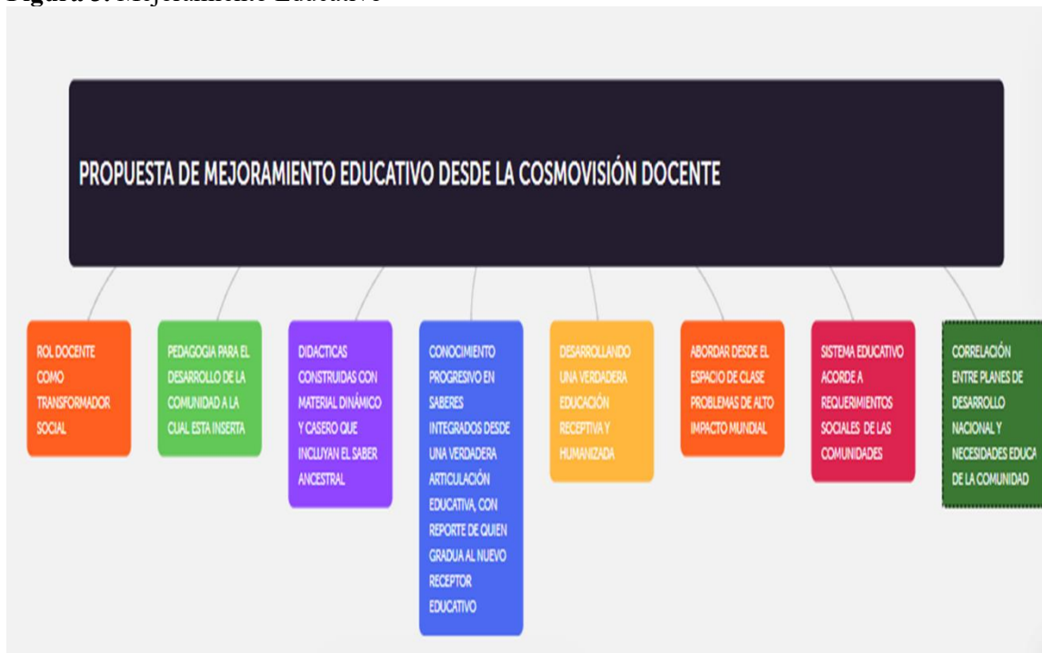
Figura 3. Mejoramiento Educativo