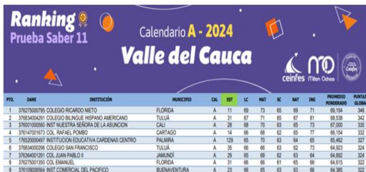
Tabla 3. Departamento del valle ICFES 11- 2024