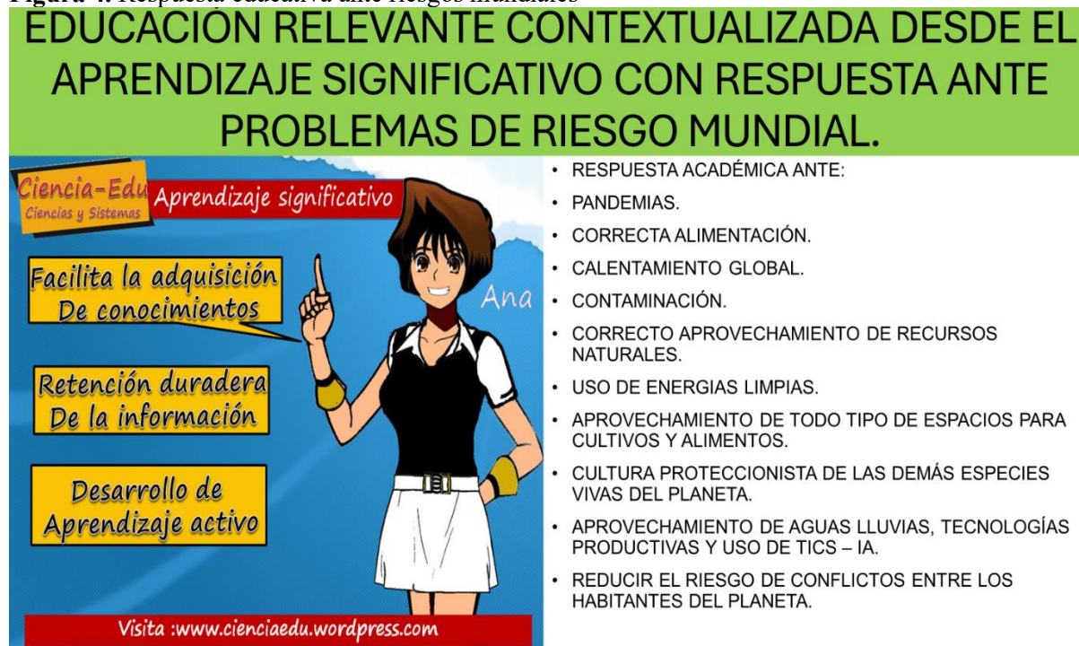
Figura 4. Respuesta educativa ante riesgos mundiales