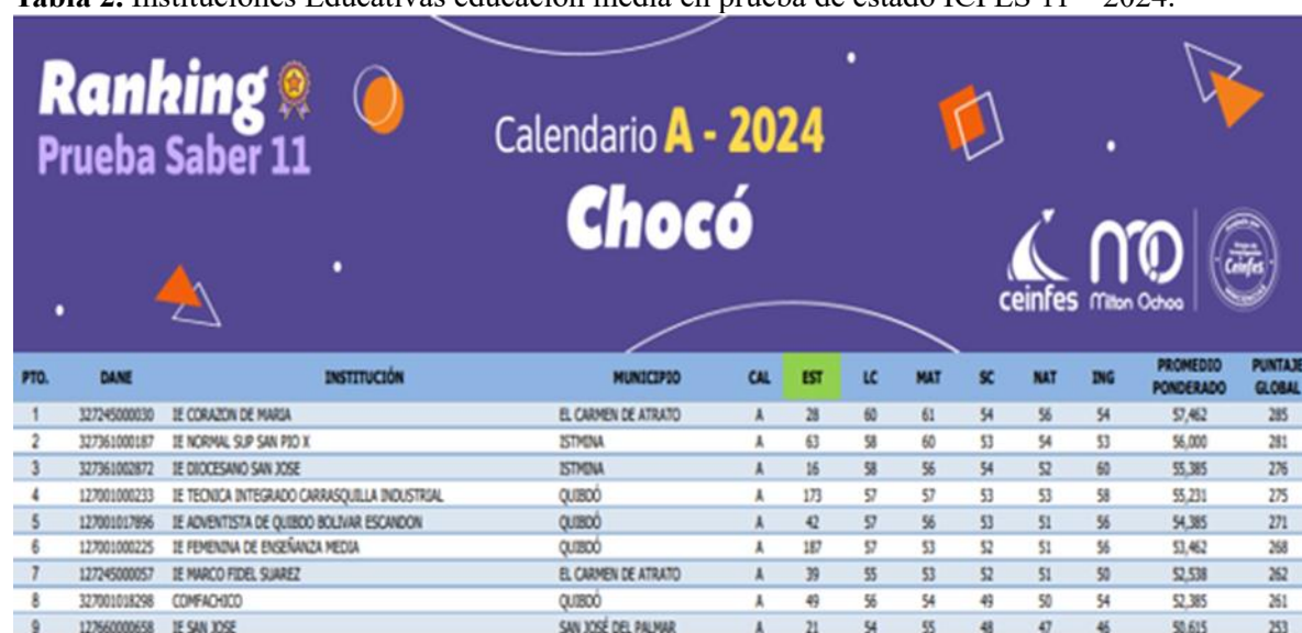
Tabla 2. Instituciones Educativas educación media en prueba de estado ICFES 11 – 2024.