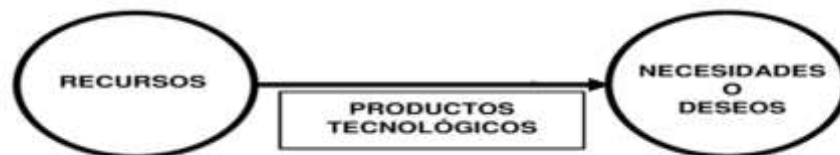
Figura 1 Proceso tecnológico