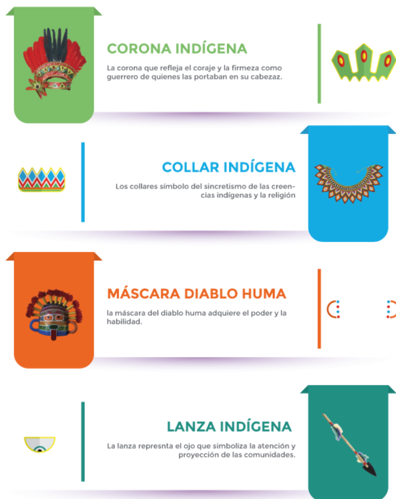
Figura 6. Infografía elementos de la marca

Realizado por: Cristian Cordova y Daniela Marcillo (2021).