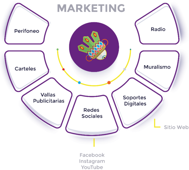
Figura 4. Infografía de Marketing