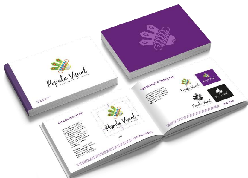
Figura 3. Mockup para el manual de marca

Realizado por: Cristian Cordova y Daniela Marcillo (2021).