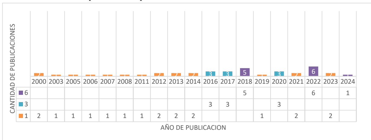
Tabla 2: Tendencia de publicaciones por año