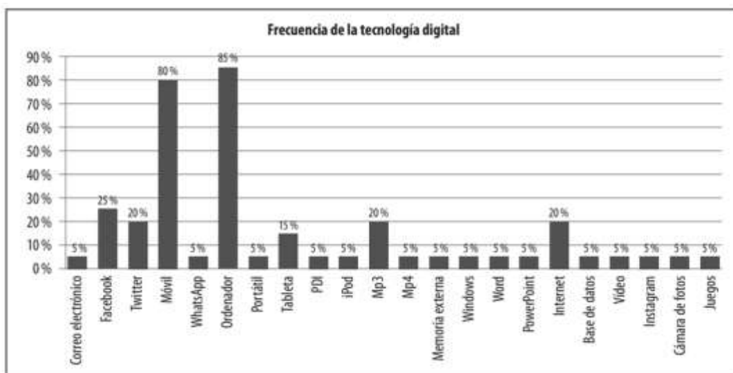
Frecuencia de la Tecnología Digital