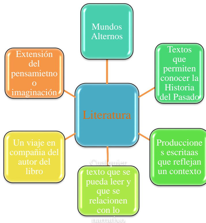
Figura 1. Nociones generales de la literatura enunciadas por los profesores de otras asignaturas del sector público del área Metropolitana de Bucaramanga

En complementación, la literatura representa un viaje, una oportunidad de conocer el mundo. Los profesores lo explican: “por ejemplo con Vargas Llosa yo fui a Perú” (1EDL); abrir las puertas de muchos mundos para que la otra persona los conozca” (1EJP); “permite conocer, aprender información de todo el mundo, de lo que no conocemos físicamente” (1EMP). En general, se ilustra las nociones que tienen los profesores de otras asignaturas en cuanto a lo que comprenden por Literatura: