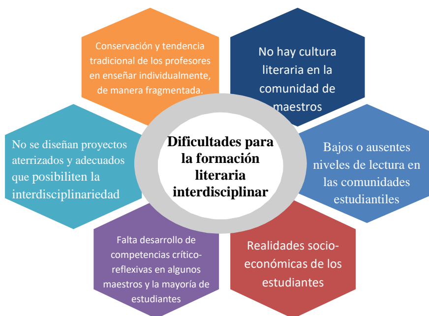
Figura 3. Dificultades que identifican los docentes de otras áreas para implementar una formación literaria interdisciplinar en sus prácticas educativas

En este orden de ideas, los profesores entrevistados sí tienen un conocimiento general de lo que supone el concepto de interdisciplinariedad, tienen claro que se requiere de varias acciones para su consecución y también requiere de la participación colectiva entre pares para el desarrollo de la misma. Sin embargo, cuando se les pregunta si en las instituciones donde laboran se han ejecutado acciones interdisciplinares, la respuesta general es negativa. De hecho, explican que dentro de sus instituciones ya se ha identificado como una debilidad dentro de sus procesos educativos, como se manifiesta en la siguiente intervención: “No, en las conversaciones que se hacen en las semanas institucionales si algunos maestros lo han planteado y se ha visto como una debilidad el hecho de que no tengamos ese tipo de trabajo articulado, interdisciplinar” (6EIS). Para ilustrar las dificultades halladas según el decir y el decir-hacer de los profesores, se encuentra la siguiente figura: