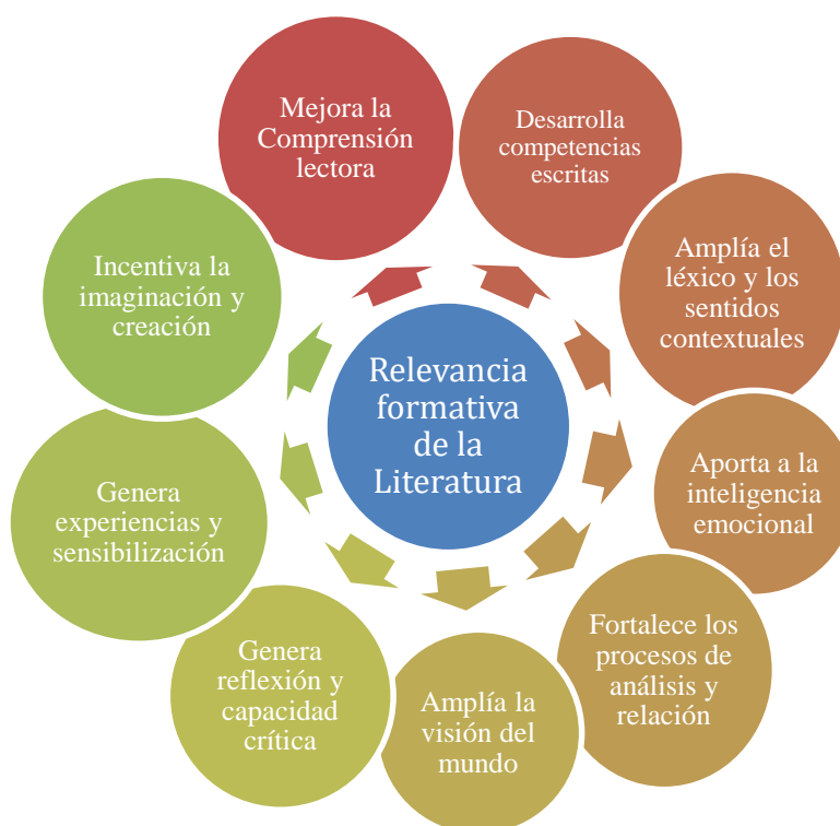
Figura 2. Relevancia Formativa de la literatura enunciada por los profesores de otras asignaturas del sector público del área Metropolitana de Bucaramanga

Y séptimo, los maestros le adjudican a la literatura la posibilidad de fortalecer el conocimiento y desarrollar el pensamiento crítico en los estudiantes, ellos mismos lo expresan: “provoca un enriquecimiento intelectual” (3EDL), tiene un “carácter funcionalista” (3EDG) y “aporta al desarrollo critico social” (3EIS) de los estudiantes. “haga conexiones críticas, profundas sobre la comprensión del texto” (3EIS). Así pues, se ilustra de forma general los aspectos relevantes para la formación educativa que se le otorga a la literatura: