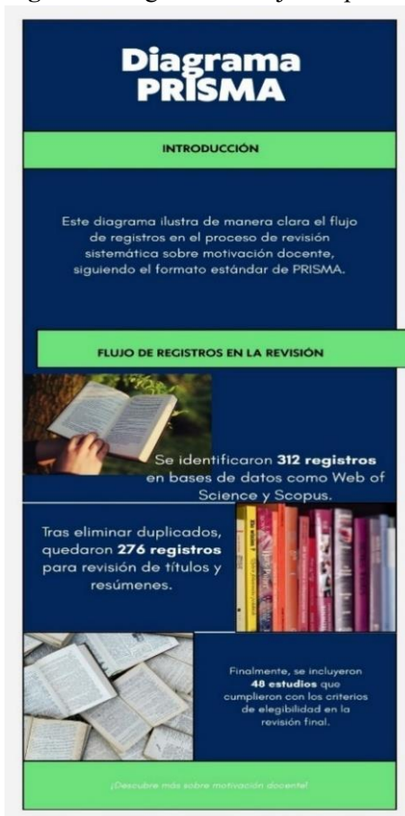
Figura 2 Diagrama de flujo del proceso de selección de literatura (adaptado del protocolo PRISMA).