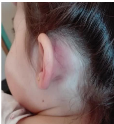
Figura 2. Signos clínicos de eritema, tumefacción y desplazamiento posterior del pabellón de la oreja. Mastoiditis.

Tomado de: Ruano-De Pablo L, Vargas-Salamanca E, Caro-García MÁ, Pérez-Heras Í. Influencia terapéutica en la evolución de la otitis media aguda. Acta otorrinolaringol cir cabeza cuello. 2018;46(1):53–8.