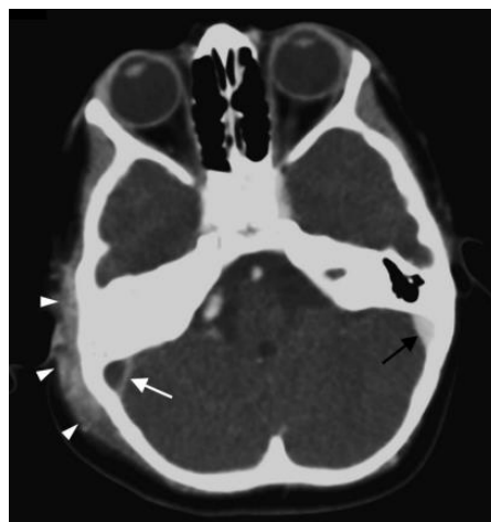
Figura 3. Tomografía axial computarizada de cráneo con contraste intravenoso que muestra defecto de repleción del seno venoso transversal por tromboflebitis (flecha blanca) con seno transversal normal (flecha negra).

Tomado de: Pont E, Mazón M. Indicaciones y hallazgos radiológicos de la otitis media aguda y sus complicaciones. Acta Otorrinolaringológica Española. 2017 Jan 1;68(1):29–37.