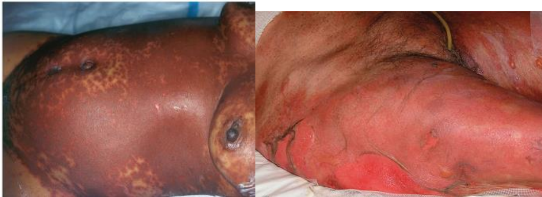
Figura 1: Manifestaciones cutáneas de la necrólisis epidérmica tóxica (NET)