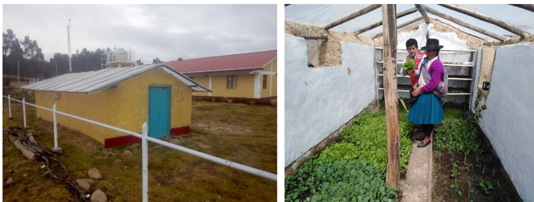
Figura N° 02: Construcción de los fitotoldos

Este invernadero, fue producto del trabajo de la comunidad aplicando la “ minka ” con un capital semilla de parte de la ONG Acorde, cuya contribución fue la entrega de los palos y el agrofil para el techo del invernadero. Producto de