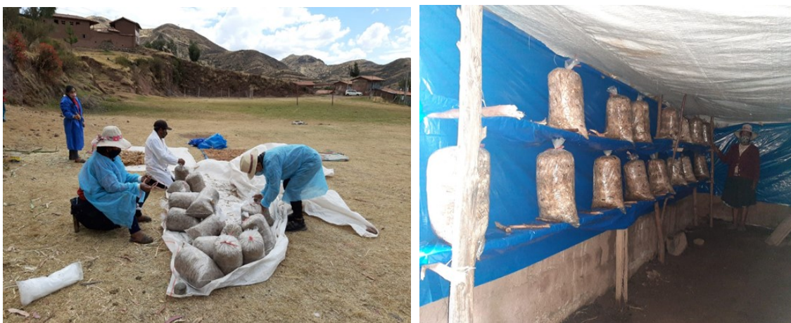
Figura N°05: Cultivo y comercialización de hongos y consumo de setas”, Acomayo.

Tercer Caso: fue la implementación “cultivo y comercialización de hongos y consumo de setas”, en la provincia de Acomayo, en el distrito de Rondocan donde se encuentra el Tambo Papres en colaboración con distintos actores desde el gobierno local, empresa privada Setas Andinas Sur, Asociación de cultivadoras y la comunidad que ha venido fortaleciendo las capacidades de la población en el cultivo de setas. Esta propuesta se desarrolla cuando el poblador compra las semillas a la empresa “Setas Andinas del Sur”, el kilo de semilla cuesta S/ 25 soles, al sembrar un kilo de setas la producción es 10 kilos de Hongo para el consumo, que luego se comercializa a S/ 25 soles el kilo. Hay que tener en cuenta que el ciclo de producción es 45 días. Es preciso señalar que la Comunidad de Papres tiene 68 familias (173 habitantes), y el 34% de las familias ha iniciado la experiencia del cultivo de hongos tipo ostras para: i) consumo alimenticio por su alto valor nutritivo; y ii) inicio de la venta en el mercado local. El consumo de las setas de los hongos contribuye a combatir la anemia y la desnutrición crónica infantil, tiene como propiedades: Vitaminas B, D, C y K, ácidos grasos insaturados (OMEGA 3,6,7,9) de los elementos minerales y microelementos, hierro, zinc, potasio, fosforo, selenio, sodio, yodo y boro y aminoácidos, proteínas y azúcares.