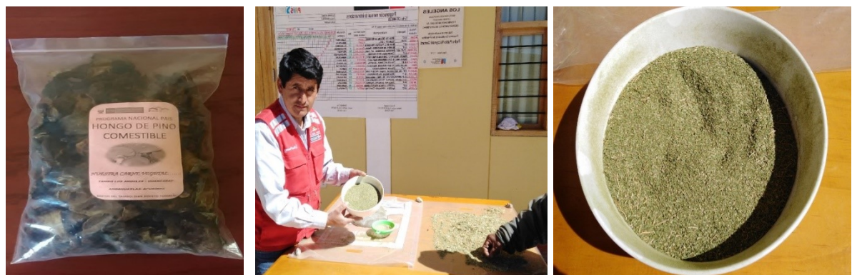
Figura N° 04: Emprendimientos, desde la Estrategia Tambo Bicentenario

Como se observa en la ilustración en la parte del fondo hay una instalación de un secador solar artesanal, donde se realiza el procesamiento del hongo de pino comestible, lugar donde se capacita a familias y madres beneficiarias del programa juntos y otros programas. De la misma forma se promueve la elaboración de la harina de Berro, a través de la deshidratación de las hojas, luego poder moler y así obtener la harina de berro.