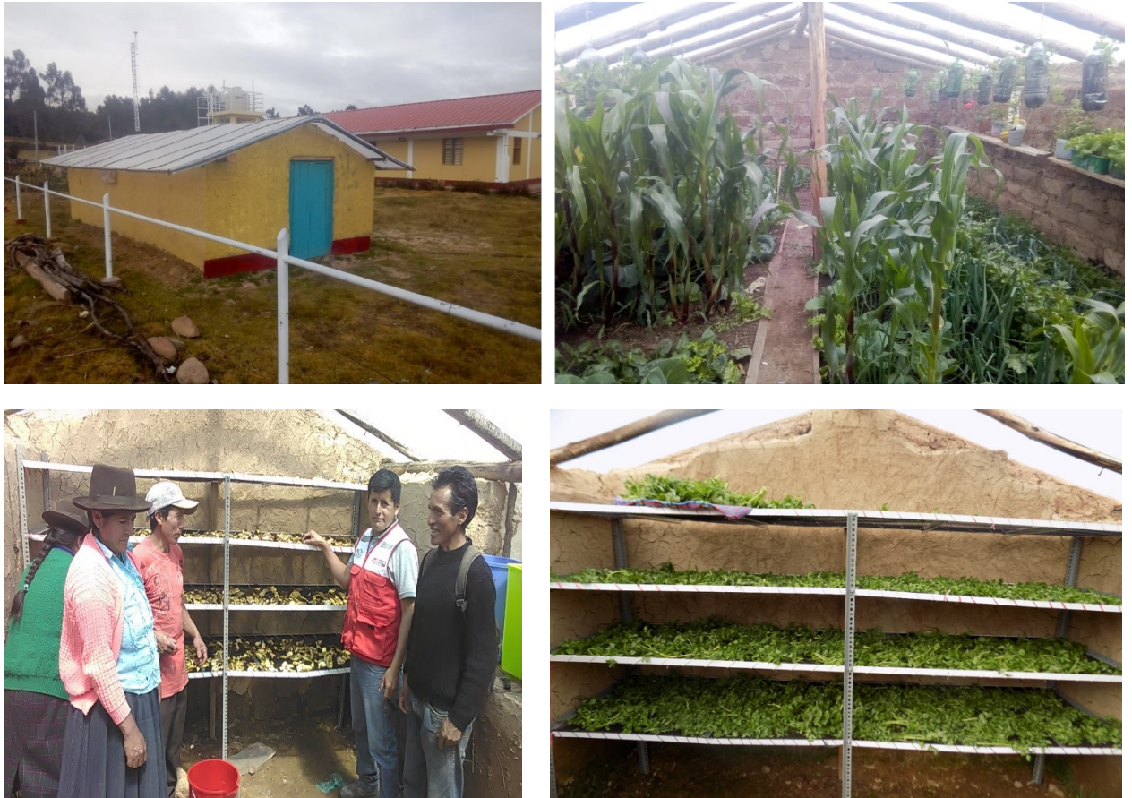
Figura N°03: implementación de la estrategia Tambo Bicentenario, módulo productivo