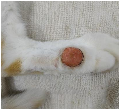
Imagen pre tratamiento de la masa, la histopatología confirmó Neurofibrosarcoma

El felino fue estadificado con hemograma completo, perfil bioquímico, análisis de orina, radiografías de tórax y ecografía de abdomen. Todas las pruebas estuvieron dentro de los límites de referencia y los estudios de imagen no evidenciaron diseminación metastásica. En radiografías del miembro no se observaron alteraciones en el tejido óseo subyacente al tumor.