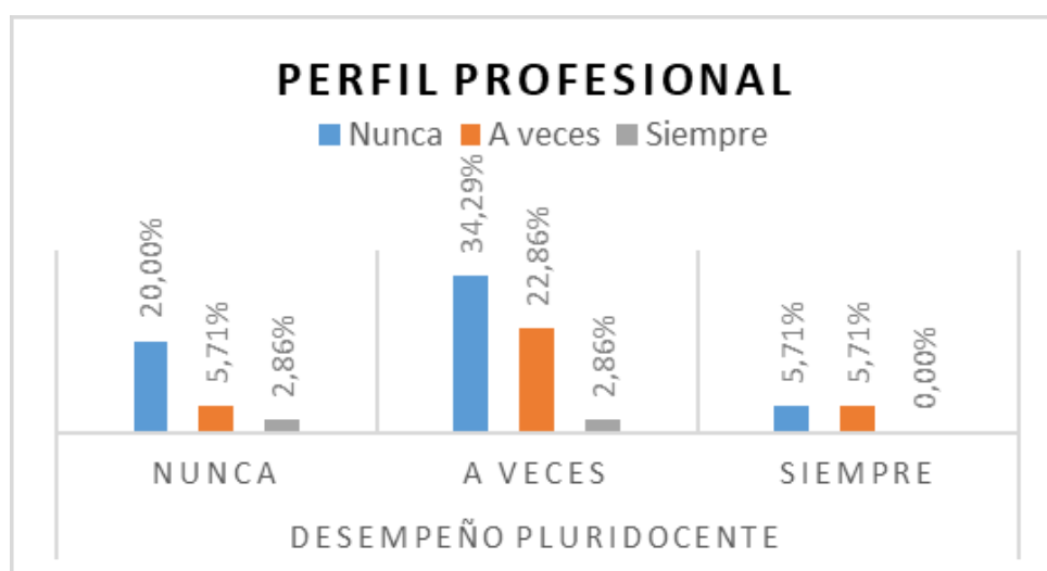
Gráfico 1: Análisis descriptivo del objetivo general