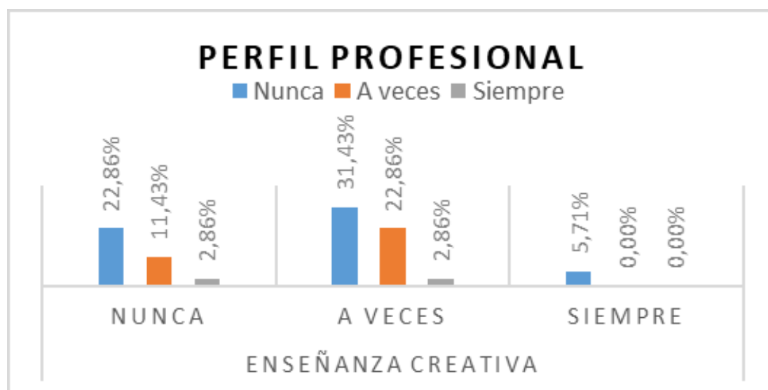
Gráfico 2: Análisis descriptivo del objetivo específico