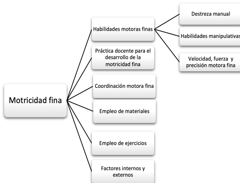
Ecuación 1 Categorías de la motricidad fina

Fuente: Elaboración propia para de las categorías para el desarrollo de la motricidad fina.