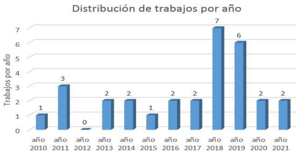
Figura 2. Distribución por año

En cuanto a la caracterización o tipo de texto, la mayor cantidad corresponde a tesis de grado con 24 trabajos y 6 artículos científicos.