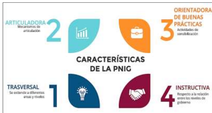
Figura 1. Características de la Política Nacional de Igualdad de Género.