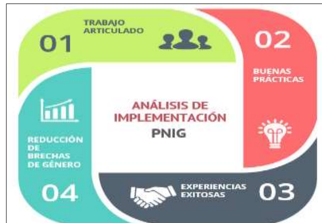
Figura 2. Análisis de aplicación de la Política Nacional de Igualdad de Género.

ha costado mucho trabajo, pero todavía falta mucho por hacer, sobre todo en Ferreñafe que abarca Instituciones Educativas en Incahuasi, Cañaris, lugares donde el machismo y los estereotipos de género se encuentran arraigados.