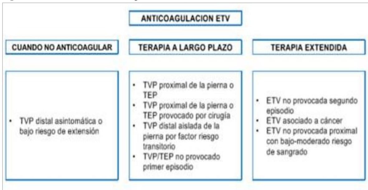
Figura 2. Indicaciones de la anticoagulación

Pese a sus efectos adversos, la warfarina es un anticoagulante que evita la actividad de los factores de coagulación dependientes de la vitamina K; su principal efecto antitrombótico está relacionado con la disminución de la protrombina, fundamental para la generación de trombina, modulador principal en la formación de coágulos, por esto y otros beneficios más, en pacientes donde se produce una hipersensibilidad a este medicamento, es importante aplicar el protocolo de desensibilización rápida a la warfarina, ya que este surge como una posibilidad terapéutica para aquellos pacientes evaluados